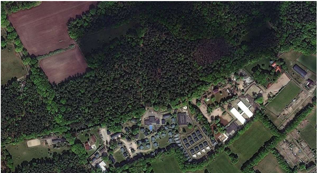
Mei 2022 (aan de noordzijde van het Landgoed zijn de lichtgroene esdoorns nog zichtbaar)

Gebleken is dat er op het perceel kadastraal bekend Gemeente Haalen, sectie A, nr. 4554 bomen zijn geveld. Uit kaart-, luchtfoto en veldonderzoek is gebleken dat het bij gaat om een velling van ( noorse Noorse) esdoorns. Op onderstaande afbeeldingen is de situatie van voor en na velling zichtbaar.